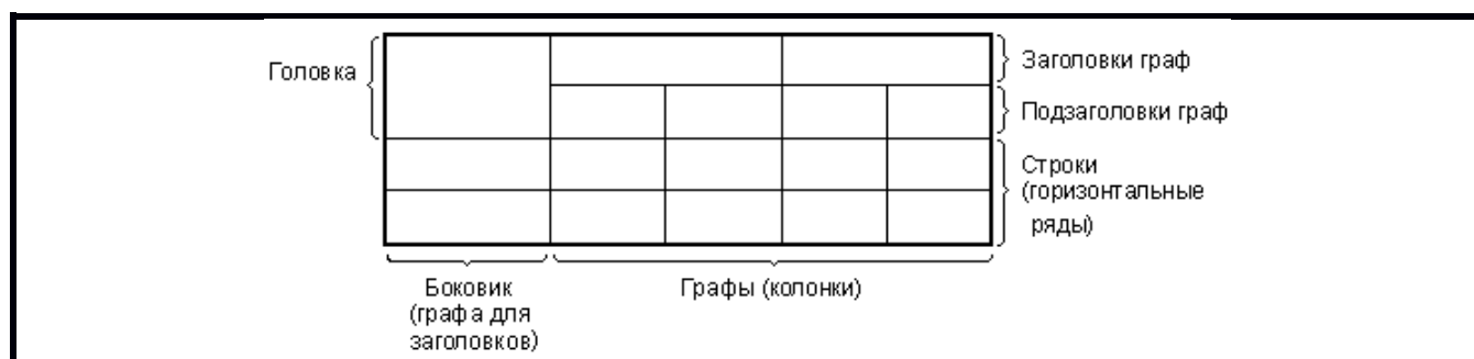
Рис. 5. Пример построения таблицы

1. Таблицы применяют для лучшей наглядности и удобства сравнения показателей. Цифровой материал, как правило, оформляют в виде таблиц в соответствии с рис. 5