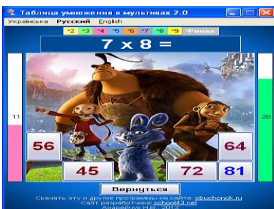
Таблица умножения в мультиках

Обучающая программа по математике, позволяющая изучать таблицу деления двузначных чисел на числа от 2 до 9 поэтапно с использованием картинок и мелодий из отечественных и зарубежных мультфильмов. Рассчитана на учащихся 2-4-х и старше классов.