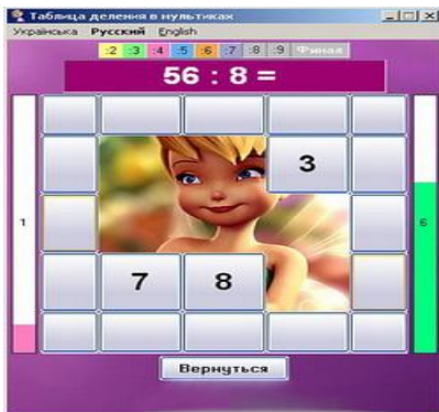
Таблица деления в мультиках

Обучающая программа по математике, позволяющая изучать таблицу деления двузначных чисел на числа от 2 до 9 поэтапно с использованием картинок и мелодий из отечественных и зарубежных мультфильмов. Рассчитана на учащихся 2-4-х и старше классов.